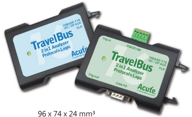
96 x 74 x 24 mm 3