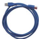
USB 3.0 傳輸線