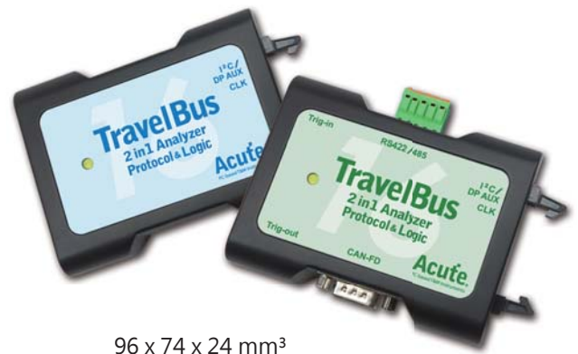
96 x 74 x 24 mm 3