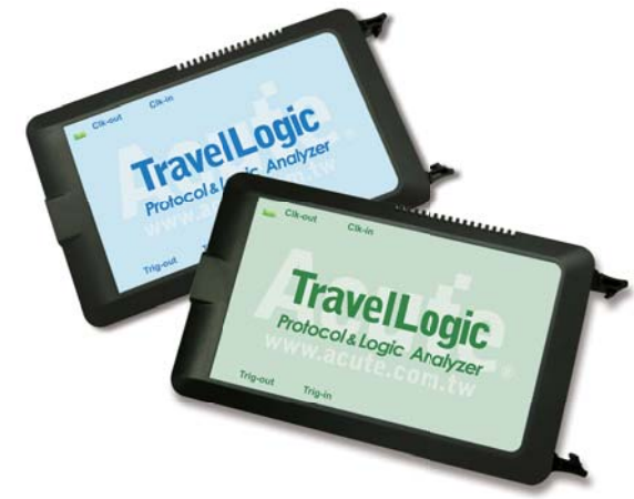
123 x 76 x 21 mm 3